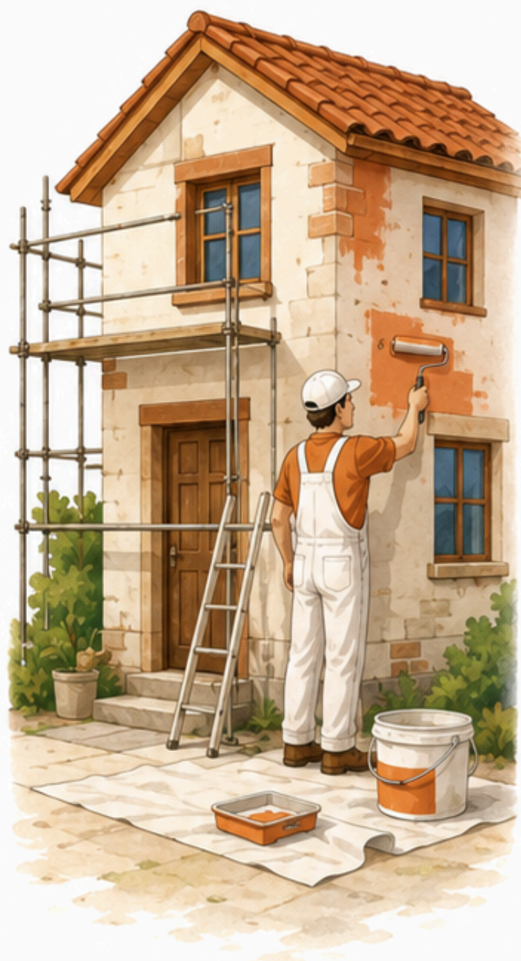
Renovar lo que tienes