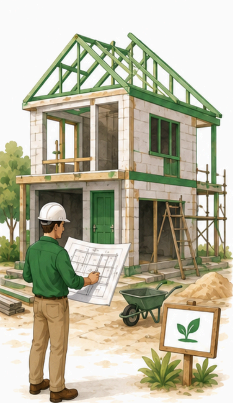
Construir de cero

Migrar a S/4HANA es cambiar de casa. Hay tres formas de hacerlo.