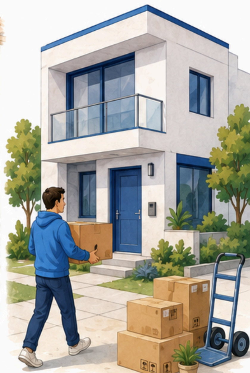
Mudar solo lo que vale